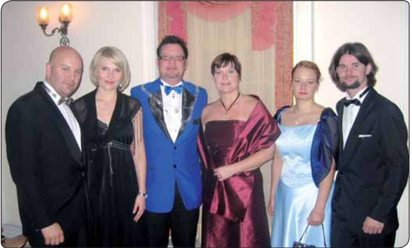
Porilaiset valmiina Galaan

M aailman Kokous (WC) vietettiin tänä vuonna Turkissa Antalyassa 5.-10.11.2007. Ensikertalaisena en oikein tiennyt mitä olisin odottanut tältä matkalta. Olin kuullut edellisistä maailmankokouksista paljon tarinoita. Nyt minulla on etuoikeus kertoa teille uusia tarinoita – kenties ensi vuonna myös sinä olet osa Suomen delegaatiota, eli ”Team Finlandia”?