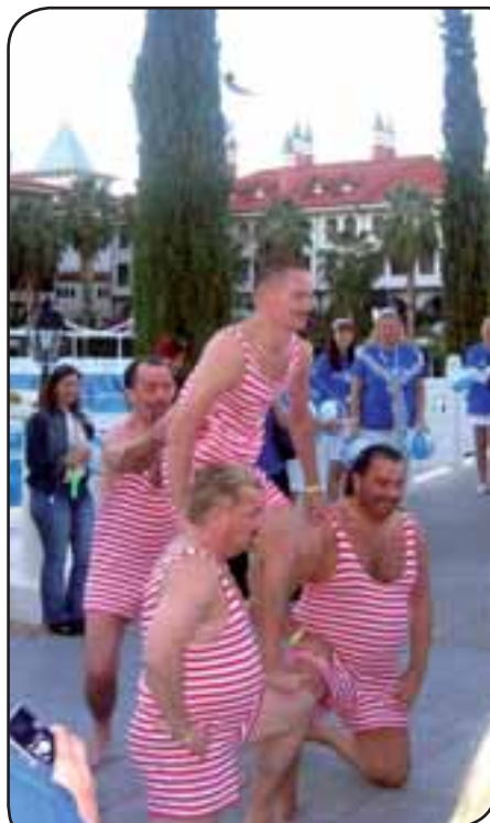
Porvoon miesvoimailijat viihdyttivät Pool Parteissa.

Suomesta matkaan lähti noin 150 JC -taustaista henkilöä. Suomalaisen teema tänä vuonna oli Turussa järjestettävä Eurooppa-kokous, Sparkling Experience, jota pyrittiin markkinoimaan tapahtumassa nä-