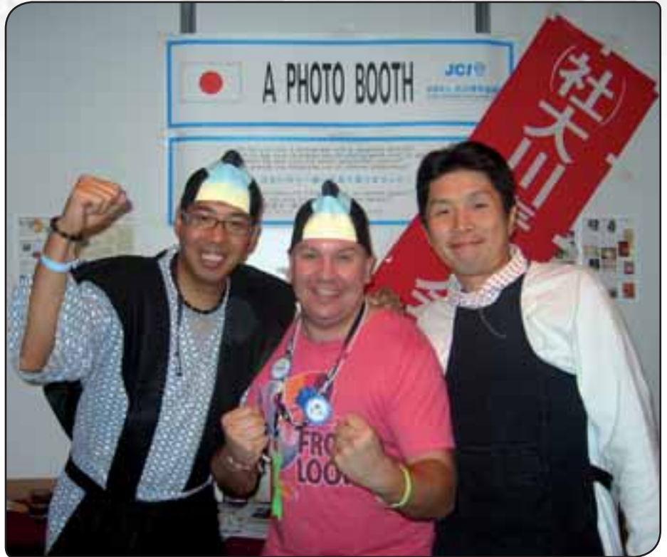
Minä Japani illassa valmiina taistoon

Sain paljon kontakteja ja uusia ystäviä. Osan heistä tulen toivottavasti näke-